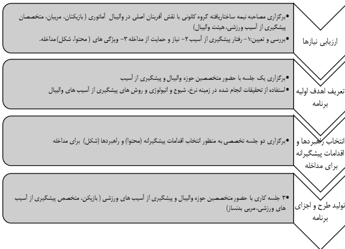
تصویر ۱. فرایند طراحی برنامه