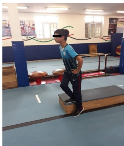
شکل ۲. اسکات تک‌پا روی پله

این آزمون شامل اسکات مداوم روی یک پله است. حین اجرای آزمون فرد دست‌های خود را روی ران قرار می‌دهد و در حالی که پنجه‌ی پا رو به بالا است، با پاشنه خود به آرامی به مدت سه دقیقه و هر دقیقه ۸۰ بار با صدای مترونوم به زمین ضربه می‌زند. ارتفاع پله طوری تنظیم می‌شود که هنگام برخورد پاشنه به زمین، زانو زاویه بین ۶۰ تا ۷۰ درجه پیدا کند. فرد در طول تست پای خود را در حالت خنثی تنظیم می‌کند و این حالت را حفظ می‌کند تا زمانی که سه الگوی حرکتی ناقص یا خطا را انجام دهد یا به‌خاطر درد بایستد و یا زمان سه دقیقه به اتمام برسد. الگوهای حرکتی ناقص شامل والگوس زانو، از دست دادن تعادل، سقوط به اطراف یا برداشتن دست‌ها از روی ران است. هر آزمون سه بار تکرار شد و میانگین سه تکرار به‌عنوان رکورد آزمودنی ثبت شد. [۱۹]