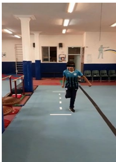
شکل ۳. سکانس آزمون لی‌لی کردن

این آزمون‌ها شامل لی‌لی تک‌پا، لی‌لی سه‌گام، لی‌لی کردن زیگزاگی (در طول دو خط که ۱۵ سانتی‌متر از هم فاصله دارند) و زمان لی‌لی کردن در یک مسیر ۶ متری است. در آزمون‌های پرش تک‌پا، پرش سه‌گام و پرش زیگزاگی فرد پس از قرار گرفتن در پشت خط شروع (پنجه پا به‌طور دقیق پشت خط شروع قرار داشت)، حرکات لی‌لی را بر روی یک پا انجام داد و سعی کرد تا حد امکان در فاصله دورتری از خط شروع قرار گیرد و پس از فرود فرد باید خود را در وضعیت فرود نگه می‌داشت تا آزمونگر بتواند نقطه فرود پاشنه را علامت بزند و بیشترین فاصله طی شده به‌عنوان رکورد آزمودنی ثبت شد، اما در آزمون لی‌لی کردن در یک مسیر ۶ متری زمان اتمام آزمون به‌عنوان رکورد فرد ثبت شد. هر آزمون سه بار تکرار شد و میانگین سه تکرار به‌عنوان رکورد آزمودنی ثبت شد. [۱۸]