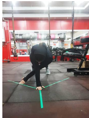
تصویر ۳: ارزیابی عملکرد اندام فوقانی

در ارزیابی استقامت عضلانی، توانایی استقامت عضلات خلفی ناحیه مرکزی بدن با استفاده از آزمون اصلاح شده بایرینگ-سورنسن سنجیده شد. ورزشکار به حالت دمر به طوری که لگن در لبه تخت درمانی قرار می‌گرفت، قرار گرفت. از فرد دیگری، برای تثبیت ورزشکار با تخت در نواحی پا و لگن کمک گرفته شد. ورزشکار بالاتنه خود را با قرار دادن دست‌هایش بر روی نیمکت در مقابل تخت حمایت کرد تا بتواند توانایی قرار دادن دست‌ها به صورت ضربدری و کسب یک موقعیت افقی را یاد بگیرد. ورزشکار باید این وضعیت را حفظ می‌کرد و زمان برای او ثبت می‌شد؛ ICC آزمون استقامت اکستنسور تنه برابر با ۰/۹۷ گزارش شده است (شکل ۴). [۲۹]