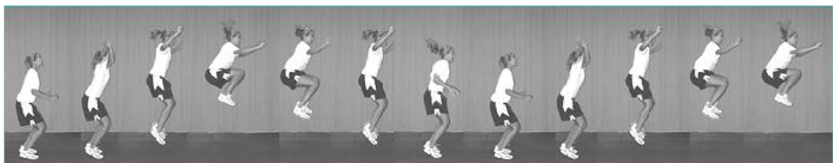
تصویر ۱: آزمون پرش تاک

آزمودنی‌ها با استفاده از آزمون پرش تاک ارزیابی شدند تا افراد مبتلا به نقص عصبی-عضلانی کنترل تنه شناسایی شوند. برای اجرای پرش تاک، ورزشکار با پاهای باز به اندازه عرض شانه می‌ایستاد و به صورت عمودی شروع به پرش می‌کرد و زانوهای خود را تا جایی که امکان داشت، بالا می‌آورد. در بالاترین نقطه پرش، ران‌ها موازی با زمین قرار دارند. هنگام فرود، ورزشکار باید پرش تاک بعدی را شروع کند. این آزمون برای ۱۰ ثانیه اجرا شد. [۲۵] برای بهبود دقت ارزیابی از دو دوربین فیلم‌برداری استفاده شد. دوربین‌ها با توجه به قد آزمودنی و به موازات صفحات عرضی و سهمی نسبت به آزمودنی تنظیم شدند. پس از انجام آزمون، برای بررسی سکانس‌های پرش از نرم‌افزار کینووا استفاده شد. [۲۵] فردی که قادر نبود در محل شروع پرش فرود بیاید، در نقطه اوج پرش ران‌های موازی با زمین قرار نمی‌گرفت و پرش‌هایش در طول ۱۰ ثانیه با وقفه انجام می‌شد، به عنوان فرد مبتلا به نقص کنترل تنه در نظر گرفته می‌شد. [۲۵]