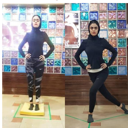
تصویر ۲: روش ارزیابی تعادل ایستا و پویا

برای ارزیابی عملکرد YBU-UQ از دستگاه تعادلی Y استفاده شد که پلیسکی (۲۰۰۹) آن را ساخته است که ضریب پایایی درونی این آزمون ۰/۸-۰/۹۹ گزارش شد. [۲۸] این دستگاه شامل صفحه ثابتی است که سه میله در سه جهت داخلی، تحتانی خارجی و فوقانی خارجی با زاویه ۱۲۰ درجه نسبت به یکدیگر به آن متصل شده است، روی هر میله بر حسب سانتی‌متر علامت‌گذاری شده و نشانگر متحرکی روی هر میله مدرج وجود دارد که دست آزاد آزمودنی آن را تا حداکثر مسافت دستیابی هل می‌داد. این آزمون برای هر دو دست سه بار تکرار شد و میانگین سه اجرا در هر جهت برای تجزیه و تحلیل استفاده شد و برای جلوگیری از خستگی، بین هر تلاش دو دقیقه استراحت داده شد. در ضمن قبل از شروع آزمون، دست برتر آزمودنی‌ها با توجه به تمایل آزمودنی‌ها در پرتاب توپ مشخص شد. طول اندام فوقانی بر فاصله دستیابی آنها اثرگذار است؛ از این رو نمره‌های خام تعادل بر اساس طول اندام فوقانی نرمال شد. برای ثبت طول اندام فوقانی، فاصله بین زائده خاری مهره هفتم تا انتهای انگشت میانی، در حالی که شانه‌ها ابداکشن ۹۰ درجه، آرنج‌ها، مچ دست و انگشتان باز شده بودند، اندازه‌گیری شد. [۲۸] فاصله دستیابی بر طول اندام فوقانی بر حسب سانتی‌متر تقسیم و در عدد ۱۰۰ ضرب شد و به منزله درصدی از طول اندام فوقانی محاسبه شد در YBT، علاوه بر در نظر گرفتن هر سه جهت به صورت مجزا، یک نمره کلی برای عملکرد از طریق فرمول زیر محاسبه شد: