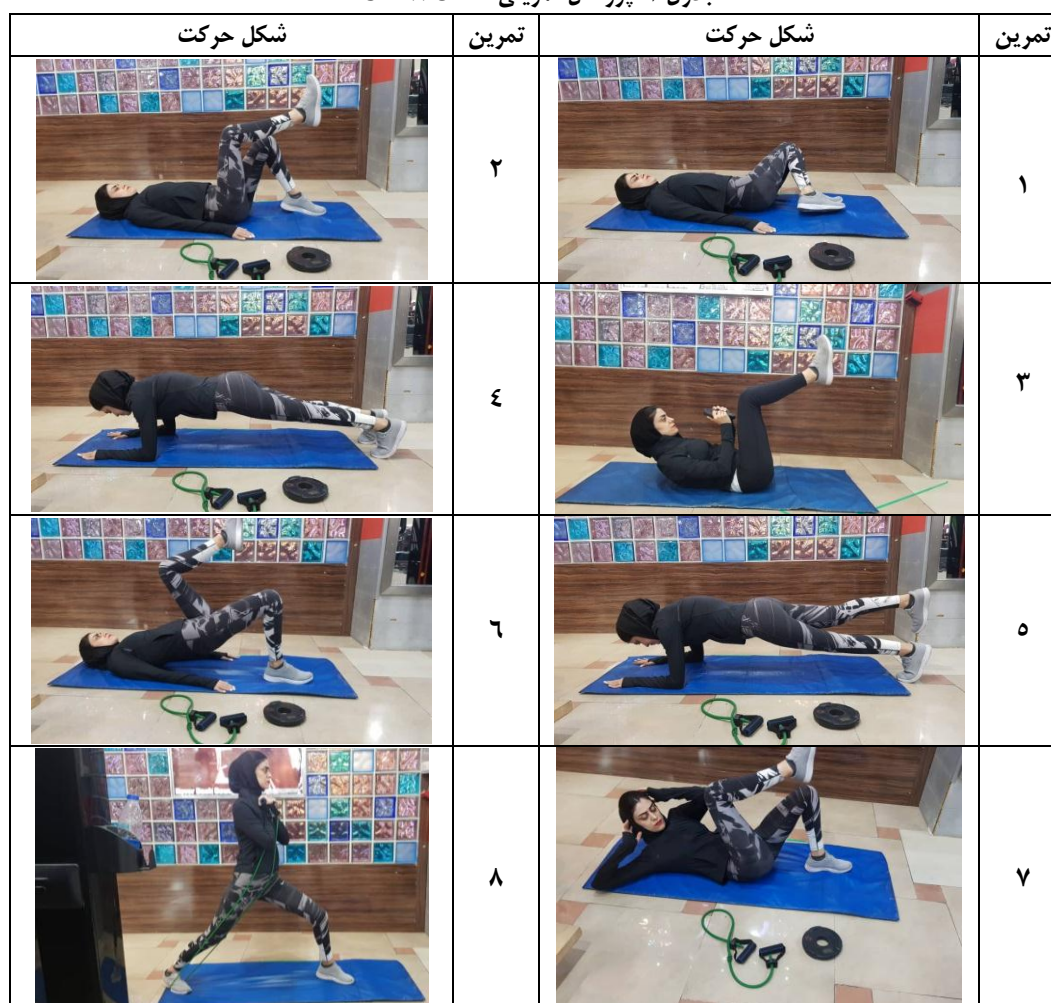
جدول ۱: پروتکل تمرینی CX WORX

جهت تجزیه و تحلیل اطلاعات جمع‌آوری شده از روش‌های آمار توصیفی و استنباطی استفاده شد. جهت بررسی طبیعی بودن توزیع داده‌ها از آزمون شاپیرو-ویلک استفاده شد. جهت مقایسه میانگین متغیرهای پژوهش قبل و بعد از پروتکل تمرینی در هر گروه از آزمون t همبسته و برای مقایسه بین گروهی متغیرها از آزمون تحلیل کوواریانس در سطح معناداری ۰/۰۵ استفاده شد. کلیه عملیات آماری به وسیله نرم‌افزار SPSS نسخه ۲۴ انجام شد.