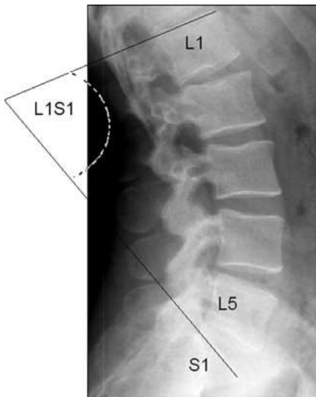
تصویر ۱: زاویه مابین سطح فوقانی مهره L1 و سطح فوقانی مهره S1

برای اندازه‌گیری زاویه لوردوز کمری در وضعیت ایستاده از بیماران تصویربرداری رادیوگرافی از نمای طرفی انجام شد و با استفاده از روش اندازه‌گیری Cobb، میزان زاویه لوردوز مشخص گردید. در این روش زاویه مابین سطح فوقانی مهره L1 و سطح فوقانی مهره S1 اندازه‌گیری می‌شود [۱۰،۳] (تصویر ۱).