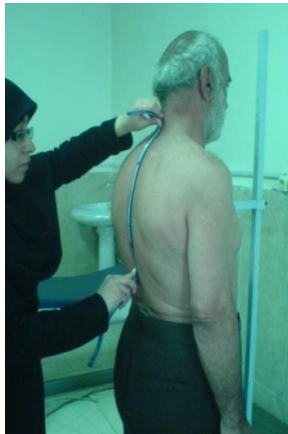
تصویر ۲. محقق در حال الگوبرداری قوس کیفوز پشتی می باشد

برای اندازه گیری کیفوز همچنین از فرمول IK = \frac{2h}{l} \times \theta که خلخالی و همکارانش اعتبار آن را ۸۹٪ گزارش کردند، استفاده گردید. [۱۷] برای اندازه گیری میزان سفتی ستون فقرات پشتی از فرد خواسته شد ستون فقرات پشتی خود را تا آنجا که می تواند صاف کند و مستقیم بایستد بدون اینکه شانه ها بالا برود و یا پاها از روی زمین بلند شود. در این حالت مجدداً خط کش انعطاف پذیر بین زوائد شوکی C 7 و T 12 قرار داده شده و شکل قوس کشیده می شد. تفاوت کیفوز وضعیت