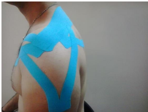
تصویر ۲: روش چسباندن کینزیوتیپ روی عضلات پکتورالیس ماژور، فیبرهای عرضی تراپزیوس، سوپراسپیناتوس و دلتوئید