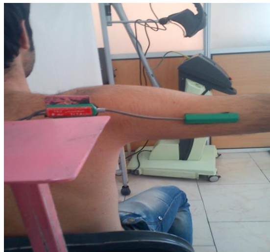
تصویر ۱: نحوه چسباندن سرهای الکتروگونیا متر برای اندازه گیری حرکت ابداکشن در وضعیت ۹۰ درجه ابداکشن (وضعیت صفر آزمون)

برای اندازه گیری حرکت دور کردن بازو از بدن دست فرد در وضعیت ۹۰ درجه ابداکشن روی تخت کنار صندلی بیمار که ارتفاع آن قابل تنظیم بود قرار می گرفت. شست آزمودنی به سمت سقف بود. یکی از سرهای الکتروگونیا متر روی ناحیه فوقانی خلفی بازو در امتداد استخوان هومروس چسبانده و سر دیگر آن روی پایه مدرجی که توسط تیم تحقیق طراحی و ساخته شده بود چسبانده می شد. پایه مدرج پشت سر بیمار در خط وسط قرار داشت تا تغییرات زاویه نسبت به یک نقطه ثابت خارج از بدن آزمودنی سنجیده شود (شکل ۱)، چرا که یکی از مشکلات اساسی در اندازه گیری خطای بازسازی زاویه مفصل شانه تحرک زیاد این مفصل و جا به جایی پوست اطراف آن است بنابراین و با توجه به این که اندازه گیری زاویه مفصل در یک صفحه حرکتی صورت می گرفت برای به حداقل رساندن این خطا، اندازه گیری نسبت به یک نقطه ثابت در بیرون بدن فرد انجام گرفت. این وضعیت به عنوان وضعیت صفر درجه در نظر گرفته شد. سپس اندام آزمودنی توسط آزمون گر از همان وضعیت و در صفحه فرونتال تا انتهای دامنه موجود ابداکشن برده می شد. کل دامنه دور کردن بازو از بدن به عنوان دامنه موجود ثبت و زوایای هدف محاسبه می گردید.